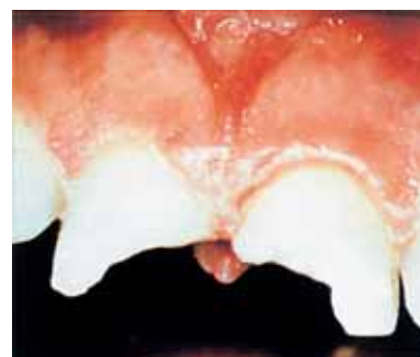
дефект в области передних зубов

Однородная структура материала и избранные частички наполнители гарантируют создание эффекта хамелеона и естественную опалесцентность. Возможность полировать до высокой степени блеска гарантирует стабильность цвета на длительное время и естественную эстетику реставрационных работ. Приятная работа с материалом благодаря свойству тиксотропии в сочетании с отличными качествами и универсальной возможностью применения Megafill MH обеспечивают успех в работе, высокое качество и большой срок службы реставраций.