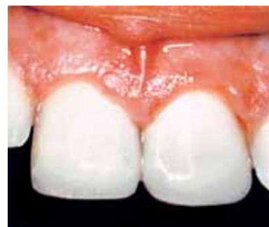
эстетический и функциональный результат лечения с помощью Megafill MH