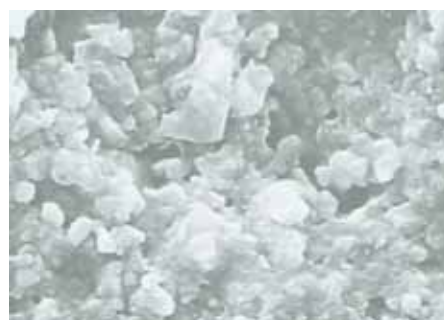
снимок поверхности сравнимого продукта