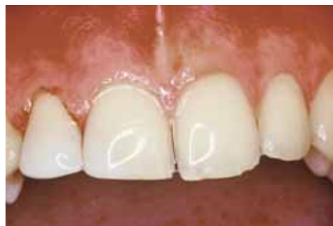
Реставрация с помощью N-Fill и N-Fill Flow