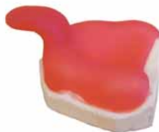
Индивидуальная слепочная ложка

розовый / синий / прозрачный (естественный)