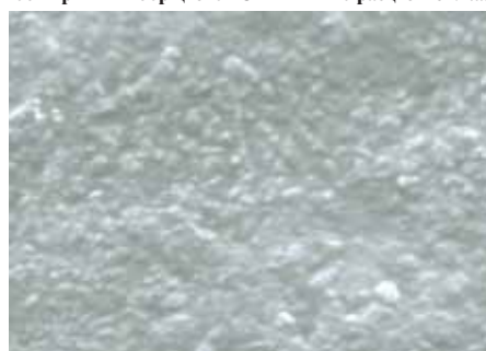
снимок поверхности C-Fill MH