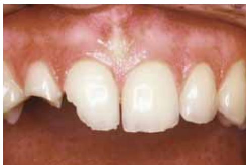
Дефект фронтального зуба

Цвета по шкале Vita: A1 / A2 / A3 / A3.5 / B2 A2 Dentin / A3 Dentin