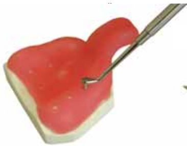
Перфорирование готовой к отверждению ложки