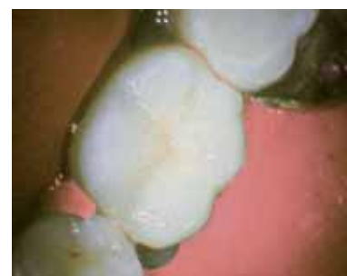
Реставрация с использованием Megafill MH CERAM